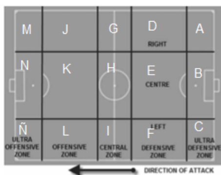
Figure 1.1 Lateral position and zone of play in the direction of the observed attacking team.

Por otra parte, para la subdivisión del campo de juego se utilizó la fragmentación espacial desarrollada por Camerino et al., donde se distinguen 3 corredores paralelos a la línea lateral (derecha, centro e izquierda) y 5 zonas paralelas a la línea del fondo de la cancha (ultra-defensiva, defensiva, central, ofensiva y ultra-ofensiva); dichas zonas permitieron establecer la ubicación del balón en el campo de juego para el lanzamiento del tiro libre directo. A su vez, se observaron aquellos remates provenientes de las zonas J, K, L, M y Ñ. Esto se debe a que los tiros libres que se ejecutan en estas zonas tienden a ir directamente a portería. La zona N no es tomada en cuenta debido a que, si se realiza una infracción en la misma, la sanción es un lanzamiento desde el punto penal. Cabe destacar que la asignación de letras para cada una de las zonas fue modificada.